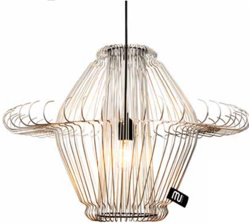
Light MI / MIRIAM ZINK