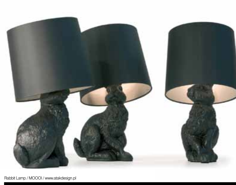
Rabbit Lamp / MOOOO / www.atakdesign.pl